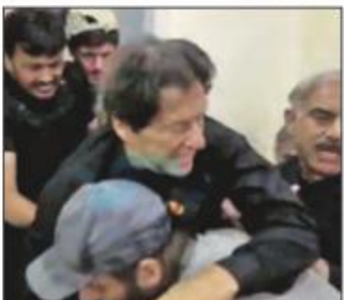
आरोपीला ताब्यात घेण्यात आले असून चौकशी सुरू झाल्याचेही पोलिसांनी सांगितले.